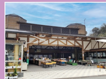
道の駅 吉野路大淀iセンター